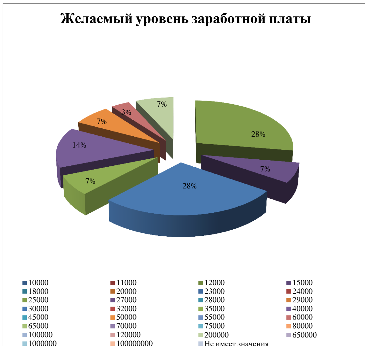
Рис.2 Желаемый уровень заработной платы

3. Желаемая должность в большинстве анкет указана в соответствии с полученным уровнем образования. Студенты, желающие получить после выпуска должности генерального или коммерческого директора, мало знают о существующих ступенях карьерного роста того или иного направления.