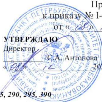
График экзаменов в группах № 195, 290, 295, 390 отделения «Туризм»